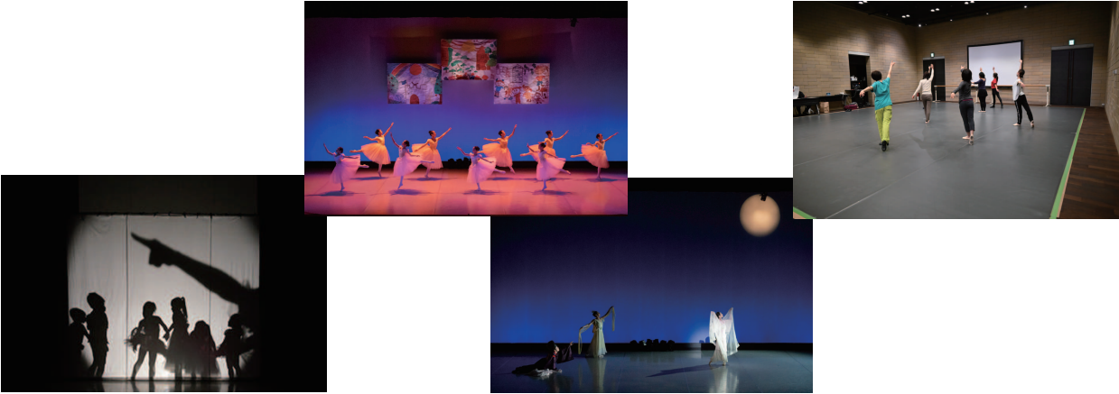
(※過去のワークショップ・発表会の様子)

発表会 | 2024年3月17日(日) 14:00開演(予定) 豊中市立文化芸術センター中ホール (アクア文化ホール)