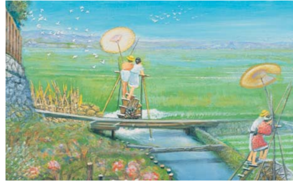
「庄内田地の灌漑用水車（夏）」制作年不詳

大正13年、信濃橋洋画研究所に学ぶ。昭和17年頃から豊中市に居住。41年頃から明治、大正期の大阪の風景を描きはじめ、54年「大阪百景」180点を大阪市立美術館に寄贈。63年、豊中市に「なにわ百景」54点を寄贈、うち33点が豊中の風景である。