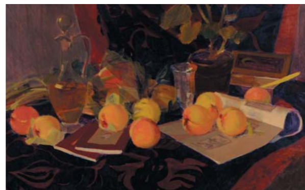
「桌上的静物」制作年不詳

大阪美術学校、信濃橋洋画研究所に学び、独立展に出品。昭和22年会員となる。昭和13年頃に蛸池に居住。昭和27年に上野西にアトリエと自宅を構える。昭和30年、豊中市美術協会設立委員、審査員。